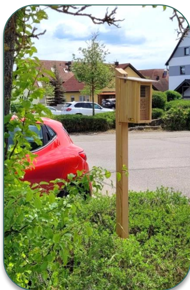
Pfosten und Einschlaghülse