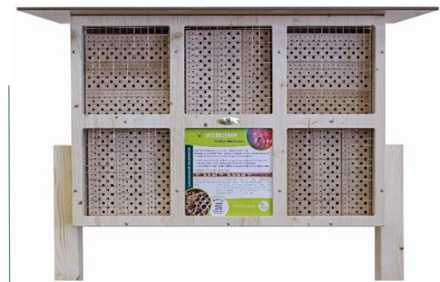
Art.Nr. NSC23WDB131 Insektenhotel BeeVario XL No 3