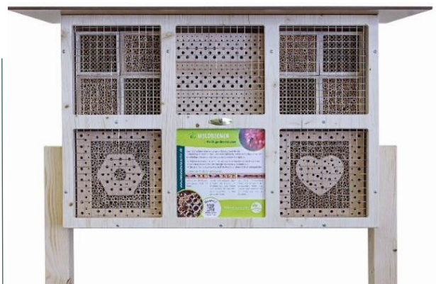
Art.Nr. NSC23WDB111 Insektenhotel BeeVario XL No 1