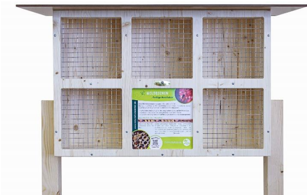
Art.Nr. NSC23WDB101 Wildbienenhotel BeeVario XL