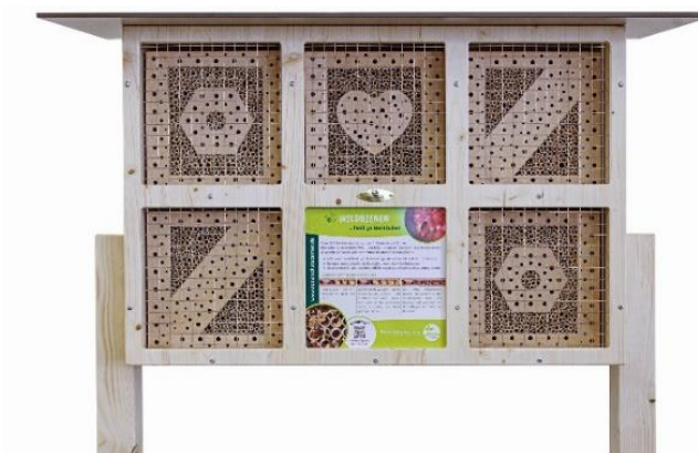
Art.Nr. NSC23WDB121 Insektenhotel BeeVario XL No 2