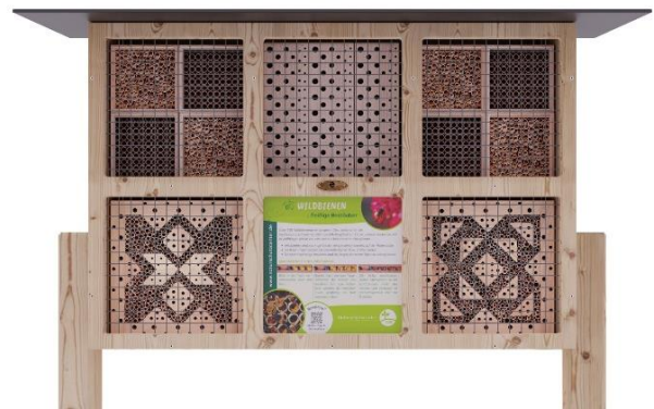
Art.Nr. NSC23WDB111 Insektenhotel BeeVario XL No 1