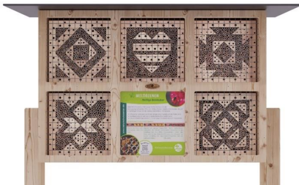
Art.Nr. NSC23WDB121 Insektenhotel BeeVario XL No 2