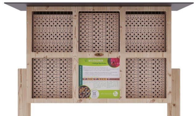
Art.Nr. NSC23WDB131 Insektenhotel BeeVario XL No 3