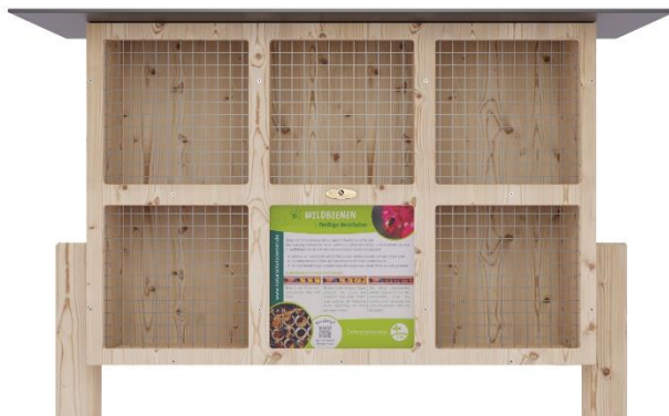
Art.Nr. NSC23WDB101 Wildbienenhotel BeeVario XL