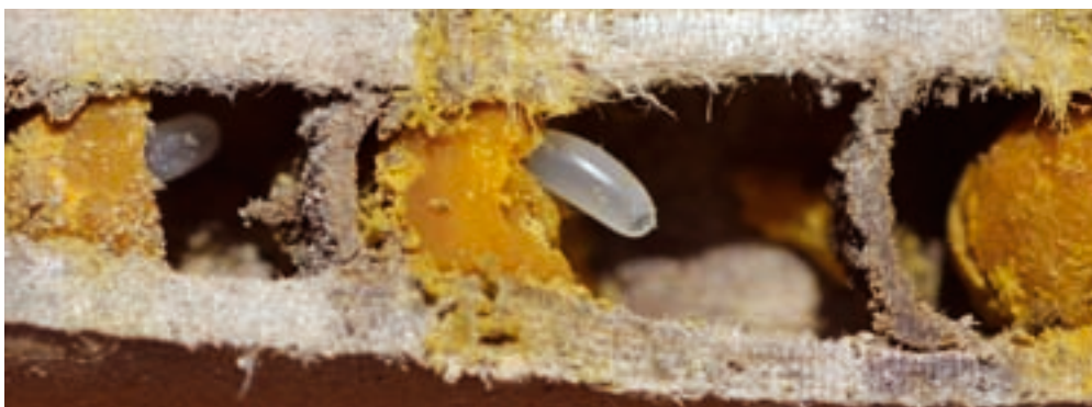
Nest der Gehörnten Mauerbiene: Einblick in die Brutkammern in einem Papprohrchen. Zu erkennen sind das Pollenbrot aus Pollen und Nektar, das kleine Stiftei und Trennwände der Brutkammern.

Direkt nach der Eiablage wird die Brutzelle mit einer Querwand verschlossen und die nächste in Angriff genommen. So entsteht eine lineare Anordnung von Brutzellen, ein Linienbau, wobei der Deckel der einen zugleich den Boden der folgenden Zelle bildet. Um diese Nachkommen braucht sie sich nach dem Einbau der Querwand nicht weiter zu kümmern, ihre Brutfürsorge ist damit beendet. Bei gutem Wetter kann das Mauerbienenweibchen an einem Tag eine Brutzelle fertig stellen.