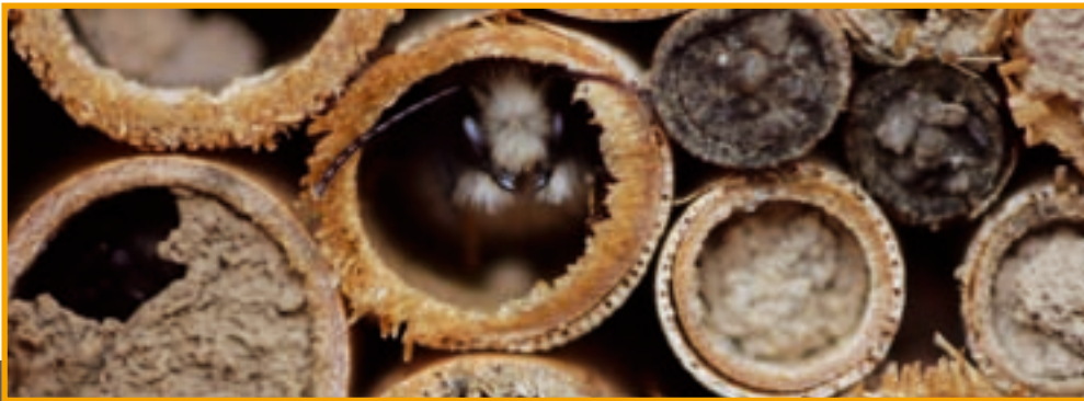
Mauerbienenmännchen haben in den Schilfhalmern übernachtet.

Die Bienen stellen die meisten Blütenbesucher – ohne sie könnten Obstbäume keine Früchte und Blumen keine Samen bilden. Neben dem „Haustier des Imkers“, der Honigbiene, sorgen bei uns vom Frühjahr bis zum Herbst etwa 560 Wildbienenarten für die Bestäubung unserer Blütenpflanzen.